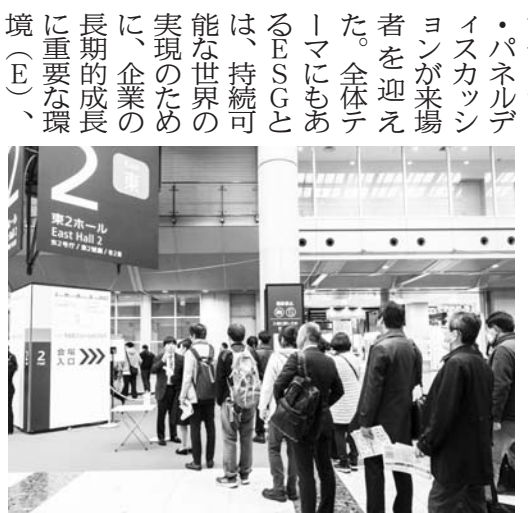
セミナー開催時には長蛇の列も

11月15日から17日まで3日間にわたり、江東区有明の東京ビッグサイトにて「第25回不動産ソリューションフェア」が開催された。今回は3年ぶりに「ビルメンヒューマンフェア&クリーンEXPO」との共同開催となった。ここでは来場登録者数の速報値や人気ブース・人気セミナーランキングをお伝えする。