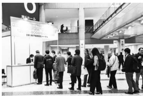
開場前には受付に列も

世界各国では2030年を達成年限とし、国連サミットで合意した世界共通の目標としてSDGs(持続可能な開発目標)に取り組んでいる。SDGは環境・気候変動への対応からジェンダー平等、健康・福祉など、幅広い分野で持続可能な社会を実現するための目標を設定している。不動産業界でも、大手を中心に多くの企業がこのSDGの活動に積極的である。17の目標のうち、1つ、「住み続けられるまちづくりを」は、正に不動産業と関係が深い。生成AIなど一丸となって取り組まなければならない課題だ。すべての人々に安全な住宅をおよび基本的なサービスへのアクセスの確保、包摂的かつ持続可能な都市化の促進、経済・社会・環境における都市部や都市周辺部および農村部間の良好なつながりの支援といったターゲットは、都市開拓やまちづくりの取組みや、サステナブルなまちづくりを点から民間企業による実践的なサポートが欠かせない。